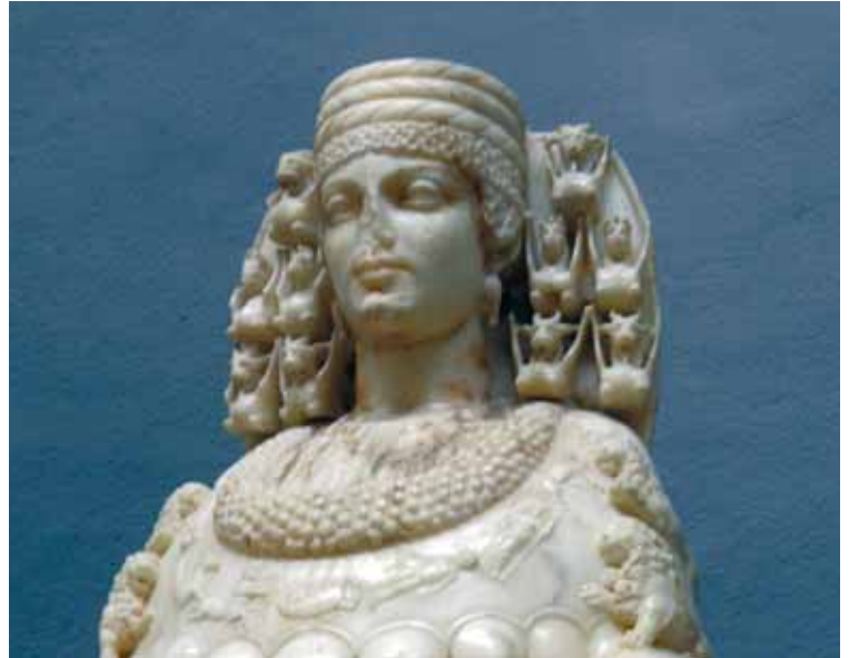
Ein Götzenbild der Artemis, wie es in Ephesus von Handwerkern hergestellt wurde. Sie sahen das Christentum als Bedrohung ihres Handwerks.

Halloween mag heute trivial erscheinen, aber die ersten Christen akzeptierten keine heidnischen Anbetungsbräuche aufgrund dessen, was Jesus und die Apostel lehrten. Und jeder Aspekt von Halloween ist im Heidentum verwurzelt. Es gibt keine Verbindung zum wahren Christentum, weil diejenigen, die dem Weg folgten, das Heidentum verließen. Das heutige Halloween wäre für sie absolut unerträglich.