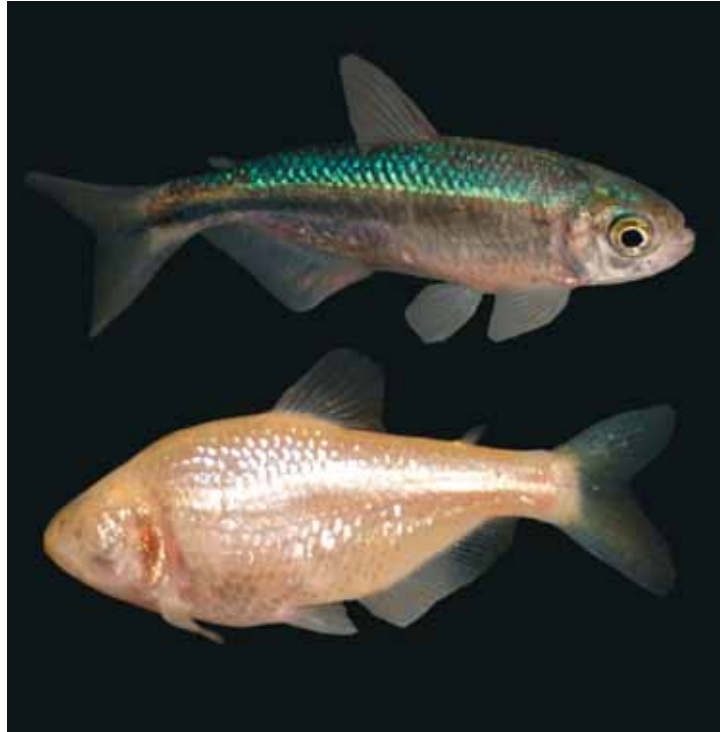
Der blinde mexikanische Salmmler lebt in der unwirtlichen Umgebung unterirdischer Höhlen. Wissenschaftler haben herausgefunden, dass sich der Fisch durch genetische Schalter anpassen kann, die an- und ausgeschaltet werden, um sein Überleben zu sichern.

Darwin irrte sich letztlich über die Ursache der Anpassung, denn er entdeckte nur unbedeutende Veränderungen innerhalb der Arten, wie die Schnabelgröße und -form verschiedener Vögel. Nichtsdestotrotz stehen die Wissenschaftler heute vor der Aufgabe, eine Erklärung für die immer entmutigendere Komplexität der Lebewesen zu finden, und ihr Schweigen angesichts der Tatsache, dass die Beweise auf einen intelligenten Designer hindeuten, ist ohrenbetäubend.